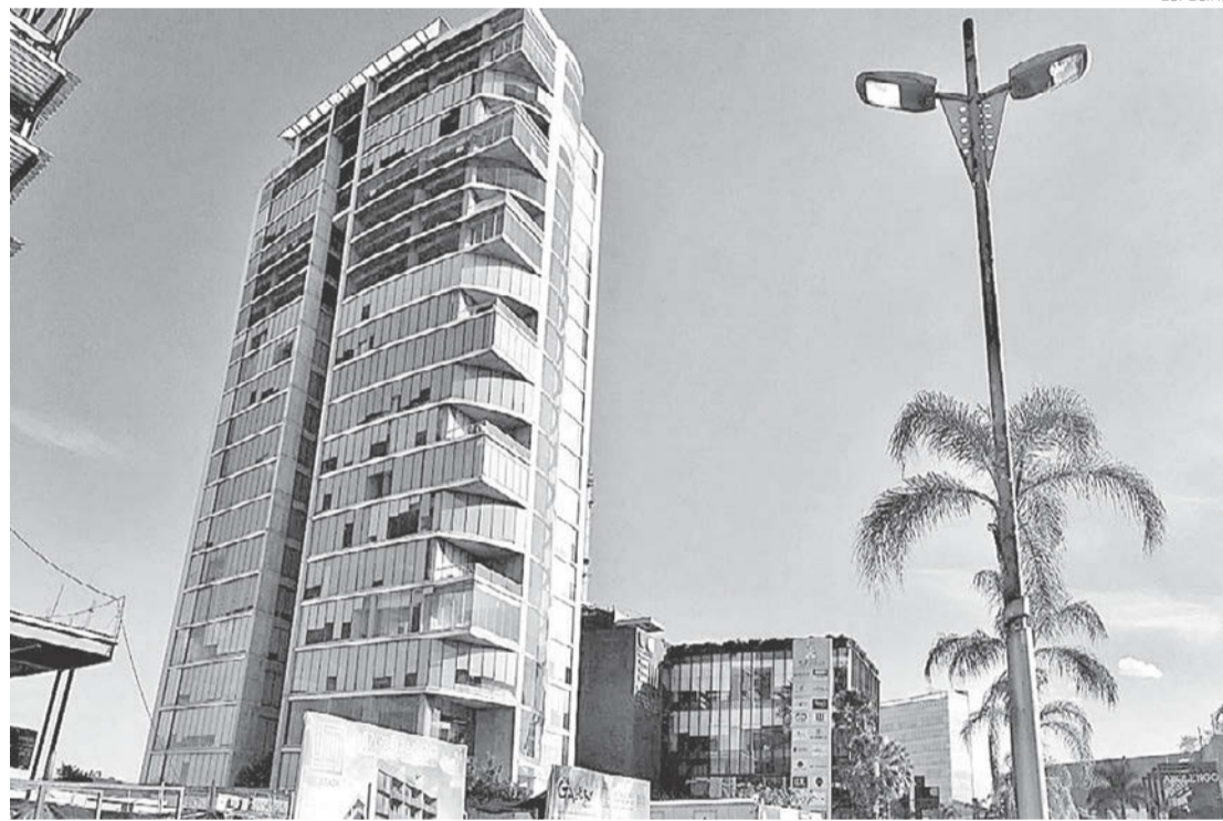
La Sofipo se ubica en Paseo Real Acueducto Interior 183 y 184 de la Torre Celtis en Puerta de Hierro

Ahorradores informaron ya presentaron quejas ante la Condusef y algunos también demandas mercantiles