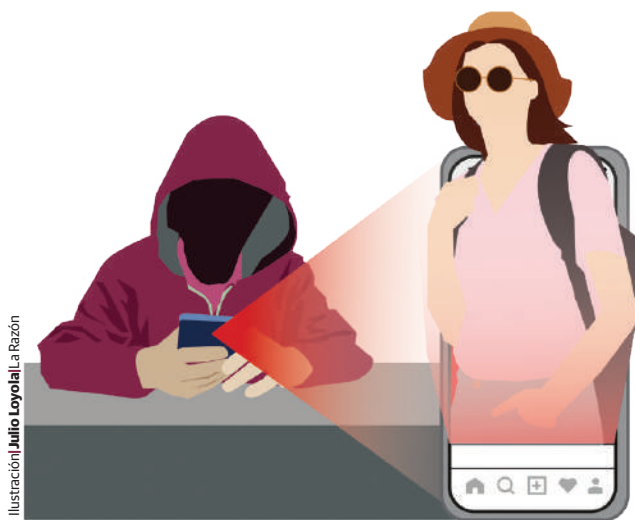
Ilustración: Julio Loyola/La Razon

Al siguiente día, Jorge dio por perdida su cuenta, pues en las historias publicaban cosas en venta como celulares, refrigeradores y otros electrodomésticos, ya