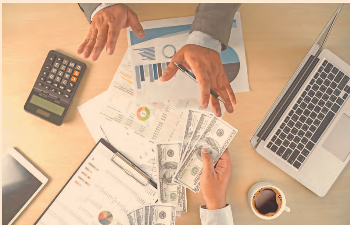
Por casos relacionados con actos de corrupción, la Unidad de Inteligencia Financiera presentó ante la Fiscalía General de la República 223 denuncias.