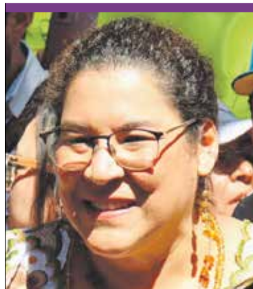
Lenia Batres. Plantea un Poder Judicial con cercanía a la gente.