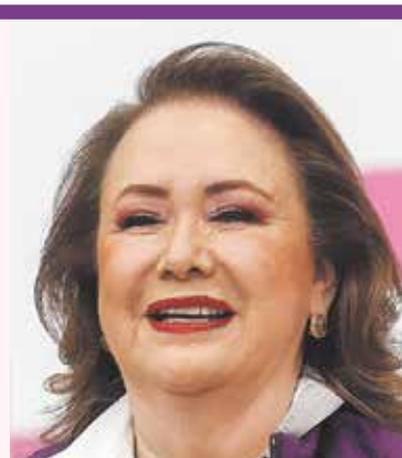
Yasmín Esquivel. Se comprometió a garantizar independencia judicial.