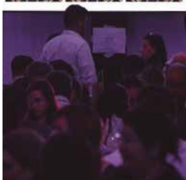
PROYECTOS. Los candidatos presentaron sus propuestas económicas.

detallar la propuesta que hizo Xóchitl Gálvez, candidata de la alianza Fuerza y Corazón por México, toda vez que se debe aclarar si la exención beneficiará a las personas físicas con actividad empresarial, o únicamente a contribuyentes personas físicas a quienes se les hace retención por sueldos y salarios.