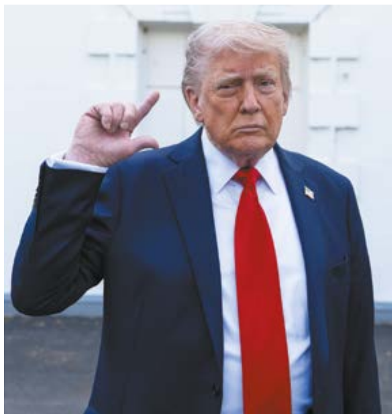
CAMBIA POSTURA. El presidente de EU, Donald Trump, da señales de rectificación.

La revisión de los aranceles también incluiría cambios relevantes en las medidas aplicadas al acero y al aluminio, materiales cruciales