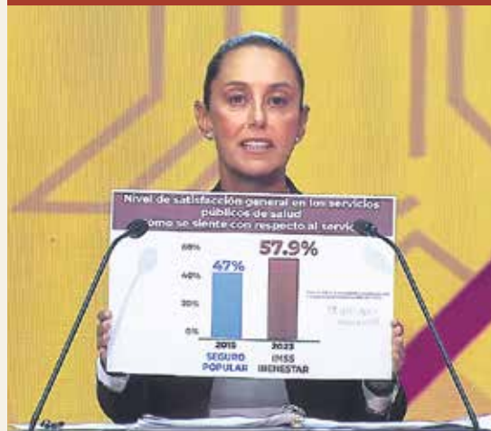
FORMATO RÍGIDO. Al final del encuentro cerraron con promesas y compromisos en caso de ganar.