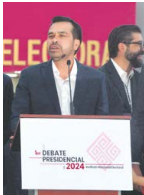
LLEGADA. Claudia Sheinbaum, Xóchitl Gálvez y Jorge Álvarez Máynez, candidatos a la Presidencia, ayer, a su arribo al INE para el primer debate presidencial.