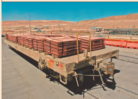
El cobre es uno de los metales industriales más utilizados en la construcción.

Aun así, la incertidumbre arancelaria puede seguir limitando el comportamiento de los precios del cobre, dijo el bróker Everbright Futures.