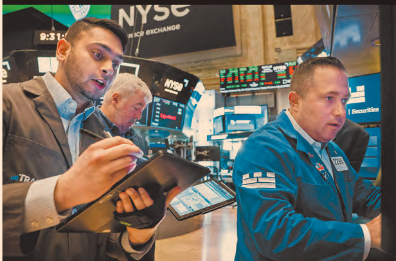
La Bolsa de Nueva York cayó el jueves, con las tecnológicas y el Nasdaq liderando las pérdidas.

semiconductores, borrarón un total de 660,525 millones de dólares en valor de capitalización en un solo día en Wall Street.