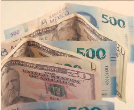
Los inversionistas están nerviosos ante las decisiones de Trump, lo que afecta la paridad del peso frente al dólar.