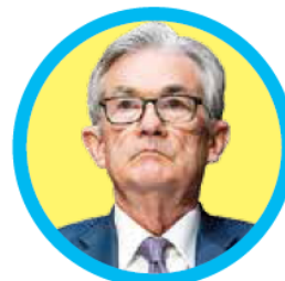
Jerome Powell, presidente de la Fed.

“Las cifras son compatibles con el aterrizaje suave que busca la Reserva Federal para la economía de Estados Unidos, es decir, un debilitamiento de la demanda que permita contener la inflación sin llegar a caer en una recesión”, sostuvo el banco.