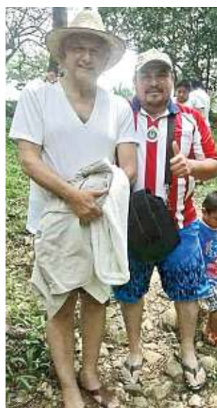
LO BUSCAN Ciudadanos no dejaron de buscar a AMLO mientras vacaciona en su rancho en Palenque. NACIONAL 5

"Aquí no se trata de vilezas, se trata de evidencias, se trata de pruebas y se trata de documentos que formalmente han sido discutidos en sesión formal del Instituto Nacional Electoral", señaló el consejero. Representantes de More-